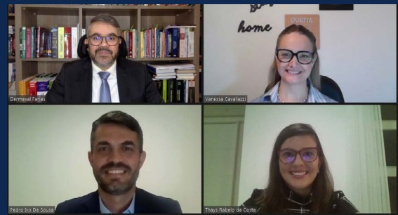
Diálogos Penais - Política Criminal e Execução Penal