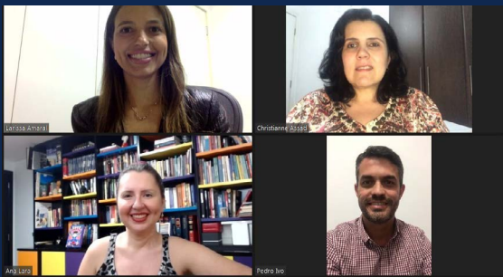
Diálogos Penais - Violência Digital

Os webinars acontecem no Youtube da CONAMP e as gravações ficam sempre disponíveis!