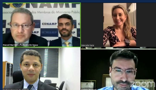
Diálogos Penais - Controle de convencionalidade pelo Ministério Público

CLIQUE AQUI PARA CONFERIR TODOS OS DEBATES